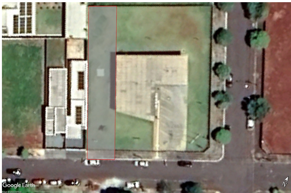
Imagem de satélite da área a sofrer intervenção (em vermelho).

Área afetada pelos serviços: Aproximadamente 360,00 m 2